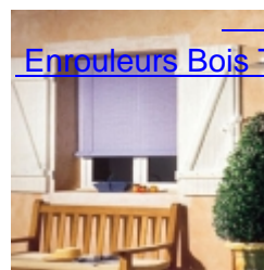
Enrouleurs Bois Tissé Extérieur Standards