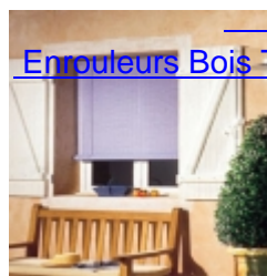
Enrouleurs Bois Tissé Extérieur Standards